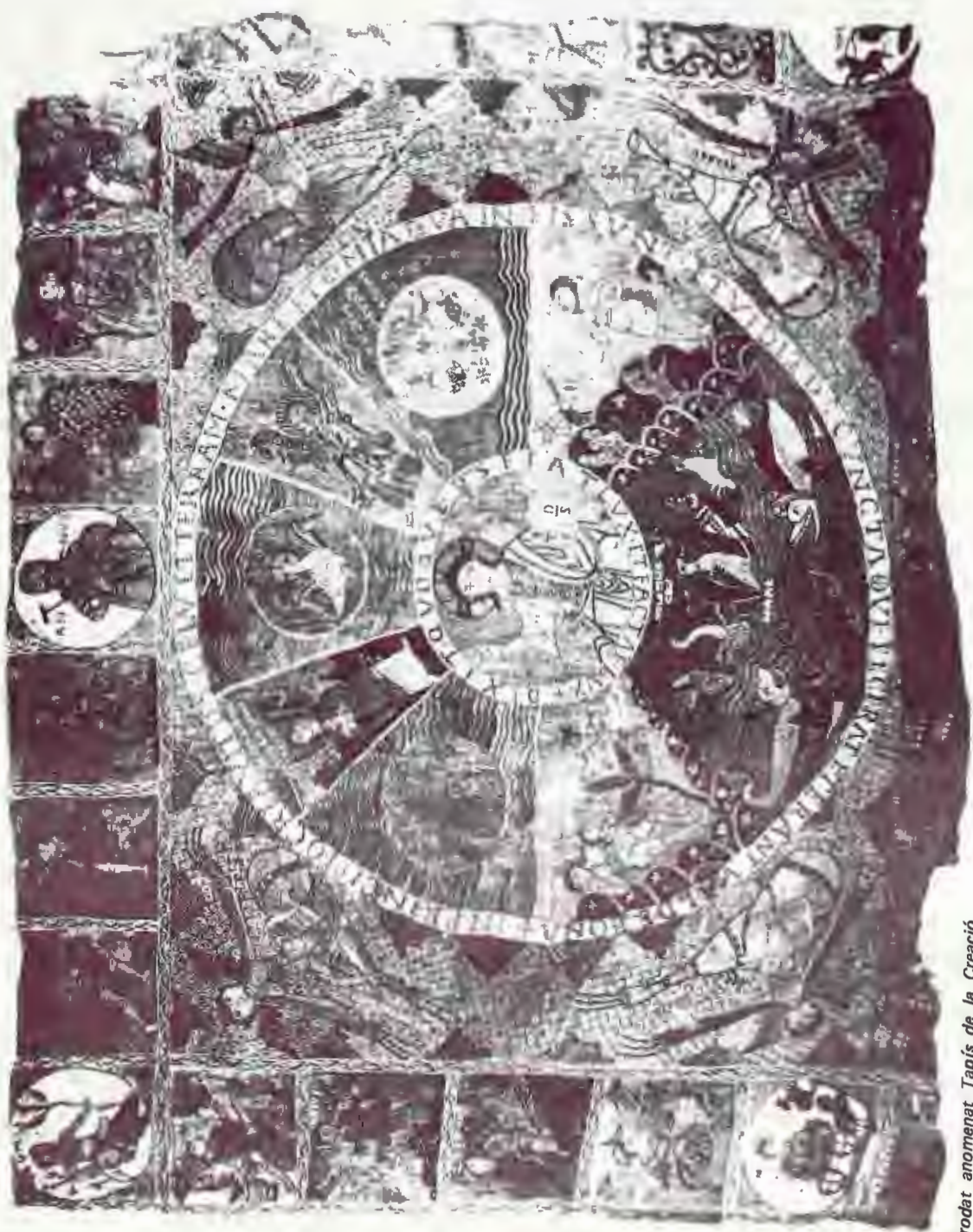
Brodat anomenat Tapís de la Creació